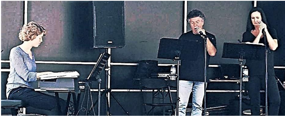
De muziekgroep Sustain brengt vier nummers als intermezzo.